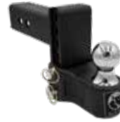
Chute/élévation 4 po Récepteur 2-1/2 po, 12K BXH12241