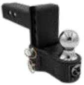
Chute/élévation 4 po Récepteur 2 po, 10K BXH10141

Ne traîne pas sur le sol comme les supports à double boule. Entièrement en acier.