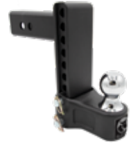
Chute/élévation 7 po Récepteur 2-1/2 po, 12K BXH12271