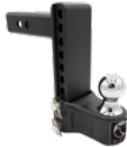
Chute/élévation 7 po Récepteur 2-1/2 po, 10K BXH10171